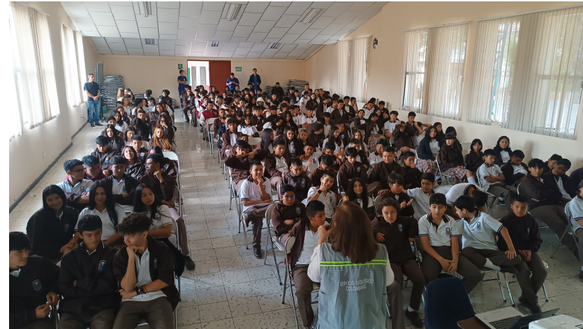
Imagen 1: Conocimiento del riesgo sísmico en Colombia - Instituto Melvin Jones de la ciudad de Popayán